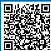
In diesen Videos berichten Schülerinnen und Schüler über die Streicherklasse.