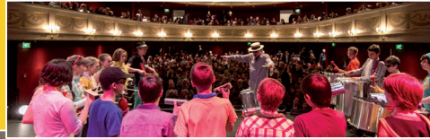
Aufführungen: Musik, Tanz, Akrobatik